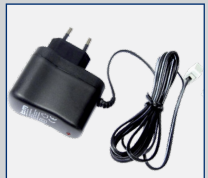
Licht-Adapter Typ 447LIA

Busch & Müller KG Auf dem Bamberg 1 58540 Meinerzhagen Germany Tel. +49(0)2354-915 -6 Fax +49(0)2354-915 -700 info@bumm.de www.bumm.de