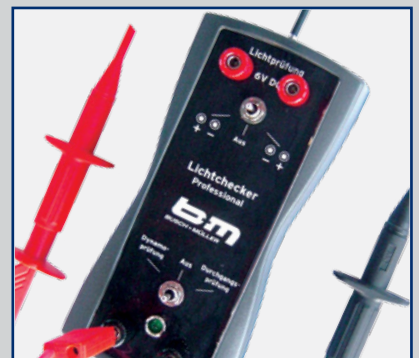
Lichtchecker Professional Typ 1516LC2