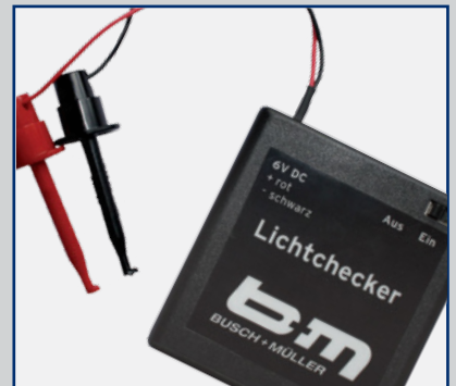
Lichtchecker Light Typ 1516LC1